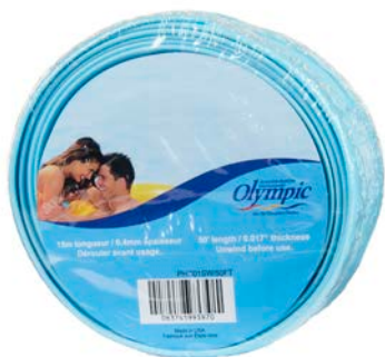
BOYAU DE VIDANGE 50' / BACKWASH HOSE 50 FT