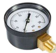
MANOMÈTRE À PRESSION RACCORD ARRIÈRE / REAR MOUNTED PRESSURE GAUGE