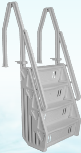
MARCHES DELUXE 32 PO GRISES / 32" DELUXE STEPS / GREY Code : 26825