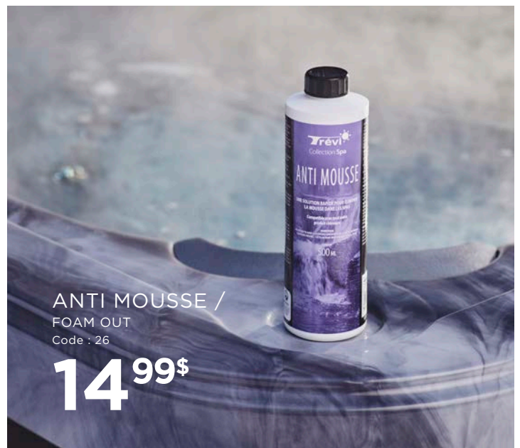
ANTI MOUSSE / FOAM OUT Code : 26