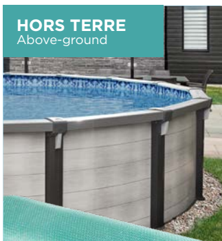
HORS TERRE Above-ground