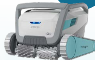
ROBOT NETTOYEUR ACTIVE 60 / ACTIVE 60 POOL CLEANER Code : 40067