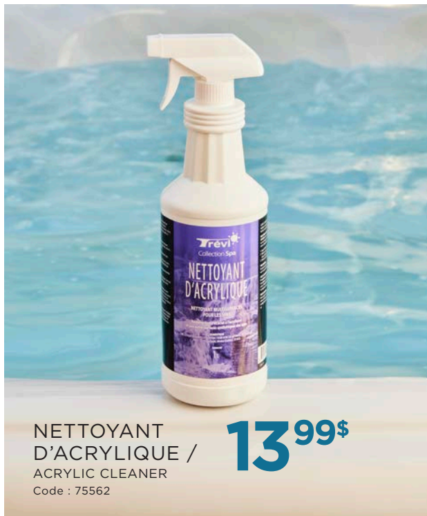
NETTOYANT D'ACRYLIQUE / ACRYLIC CLEANER Code : 75562