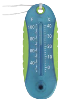
THERMOMÈTRE MULTI-SERIES / MULTI-SERIES THERMOMETER