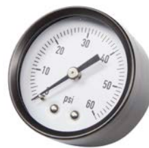
MANOMÈTRE À PRESSION RACCORD ARRIÈRE / REAR MOUNTED PRESSURE GAUGE