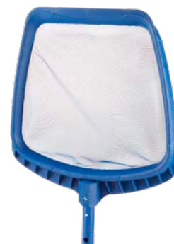
RAMASSE- FEUILLES / LEAF COLLECTOR