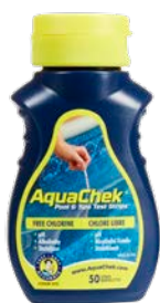
LANGUETTES AQUACHEK 4 EN 1 / AQUACHEK® 4 IN STRIPS