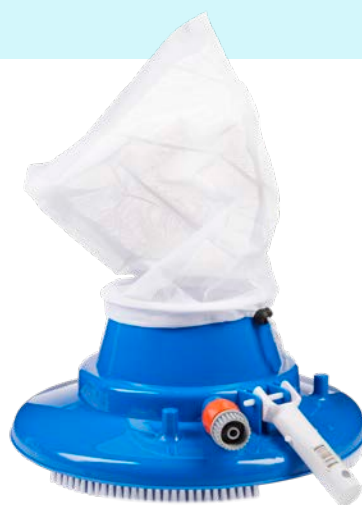
NETTOYEUR RAMASSE-FEUILLES / LEAF EATER WITH FILTER BAG AND SWIVEL WHEELS