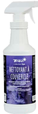
NETTOYANT À COUVERCLE / COVER CLEANER Code : 47281