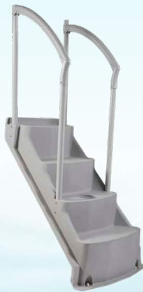
MARCHES ROYALE II GRISES LUMI-O / ROYAL ENTRANCE II WALK-IN STEPS BY LUMI-O Code : 23249