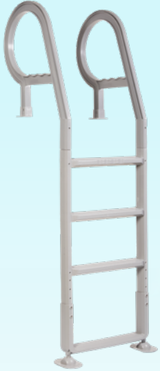
ÉCHELLE DE DECK EN RÉSINE GRISE / GREY RESIN DECK LADDER Code : 32028