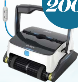
ROBOT NETTOYEUR OPSON / OPSON POOL CLEANER Code : 29687