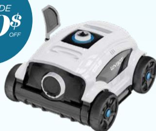
ROBOT NETTOYEUR TYPHOR 3 / TYPHOR 3 POOL CLEANER Code : 29685