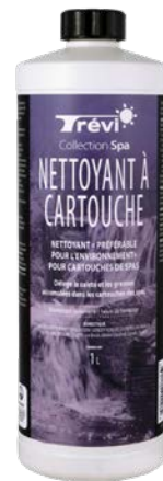
NETTOYANT À CARTOUCHE / FILTER CLEANER Code : 28