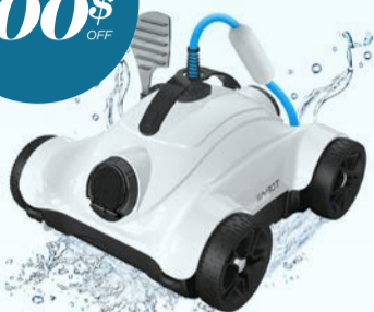
ROBOT NETTOYEUR FALCON 2 / FALCON 2 POOL CLEANER Code : 29684