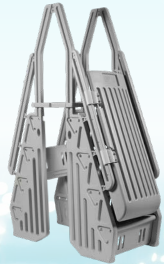
ÉCHELLE DOUBLE 24 PO GRISE VINYL WORKS / DOUBLE LADDER 24" / GREY Code : 40081