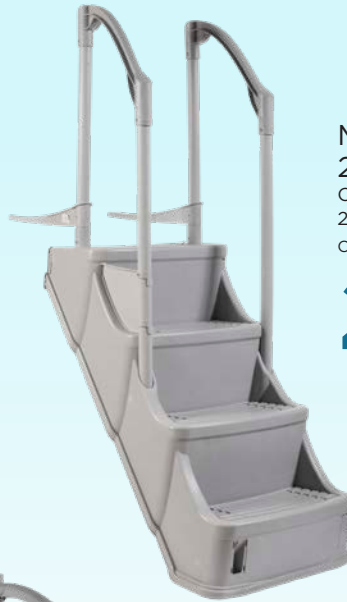
MARCHES GRISES AVEC 2 RAMPES OLYMPIC / OLYMPIC GREY STEPS WITH 2 HANDRAILS Code : 14238