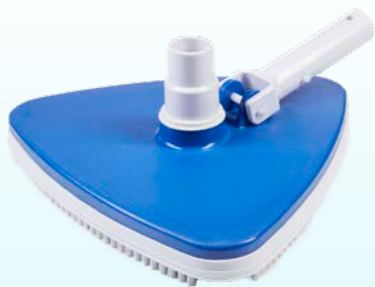
TÊTE D'ASPIRATEUR / VACUUM HEAD