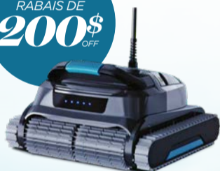
ROBOT NETTOYEUR BOOMBOT / BOOMBOT POOL CLEANER Code : 29688