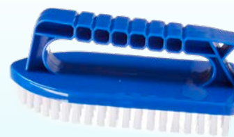
BROSSE À RÉCUPER TOUT USAGE / ALL-PURPOSE SCRUB BRUSH