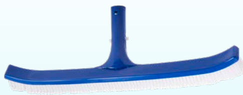
BROSSE MURALE 18" EN PLASTIQUE / 18" PLASTIC WALL BRUSH