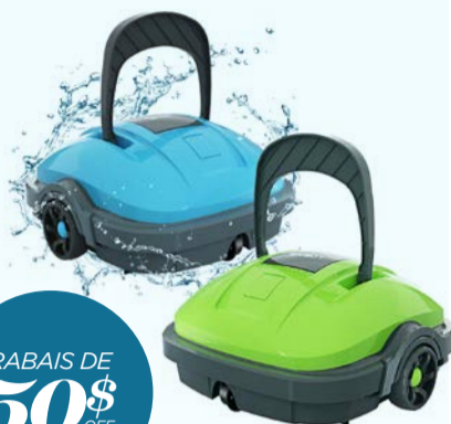
ROBOT NETTOYEUR OSPREY / OSPREY POOL CLEANER Code : 29683