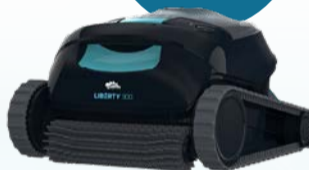
ROBOT NETTOYEUR LIBERTY 300 / LIBERTY 300 POOL CLEANER Code : 40069