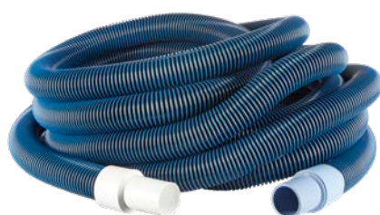
BOYAU DE BALAYEUSE DELUXE 1 1/2-25' / 1 1/2" - 25' DELUXE VACUUM HOSE